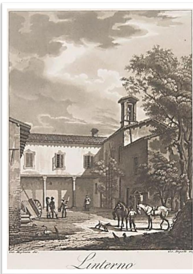
Giovanni Migliara - Veduta di Linterno – Acquatinta – 1820