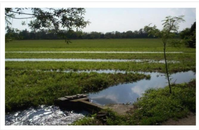
Milano – Il Parco delle Cave, Cascina Linterno e la Storica Marcita