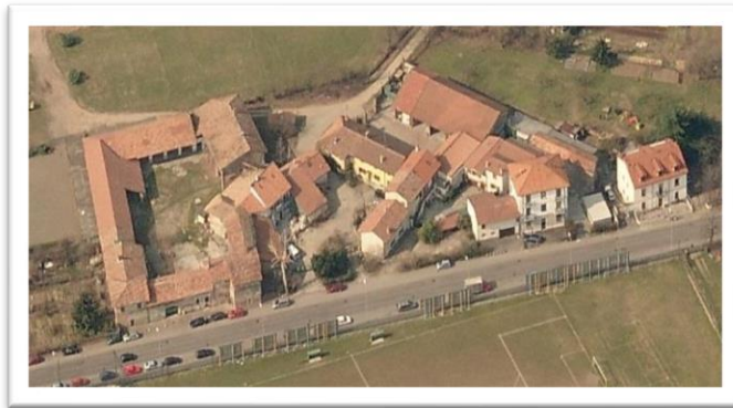
L'Antico Borgo di Cascina Linterno – Via Flli Zoia 182, 184, 186, 190 e 194